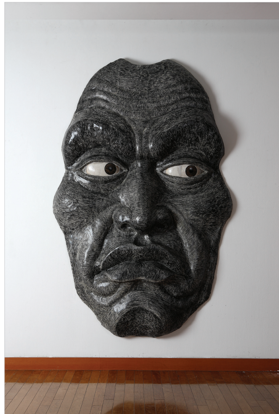
2008 face 220x130x15cm, 4B pencil on FRP resin