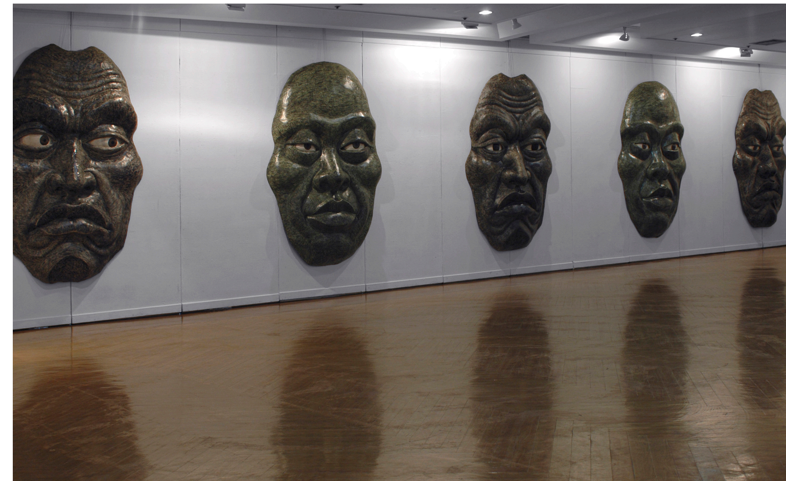
2008 face in face