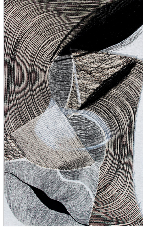
2025 face 53.0x33.3cm machin drawing,pencil on canvas(1)

재봉틀을 드로잉 도구로 전환한 머신 드로잉은 전시의 '부' 파트에서 중요한 대비를 이룬다. 레진 표면의 단단한 층이 불안