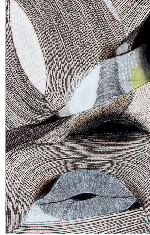
2025 face 53.0x33.3cm machin drawing,pencil on canvas (2)

의 압력을 응고시킨다면, 천과 실 위의 스티치는 그 압력을 다른 방식으로 견디고 꺾인다.